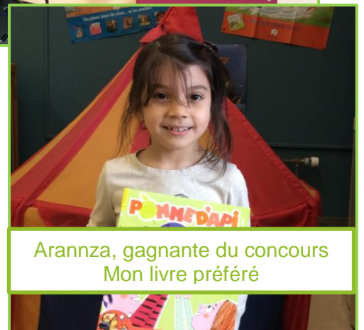
Arannza, gagnante du concours Mon livre préféré