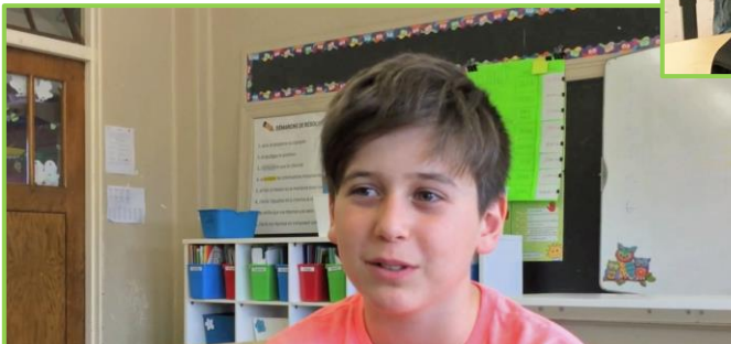
Forum des enfants HM : la parole aux enfants