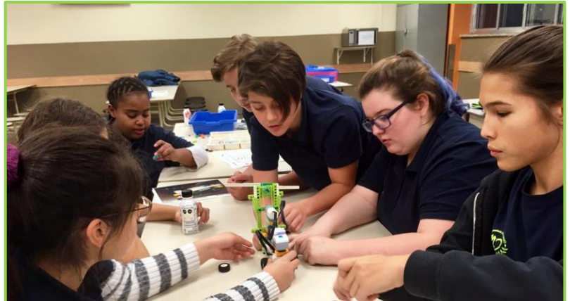
Robotique : les compétences du 21 e siècle