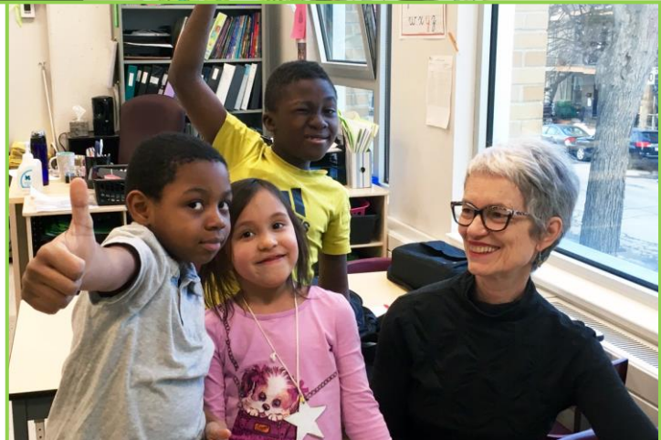
Notre projet de lecture intergénérationnel