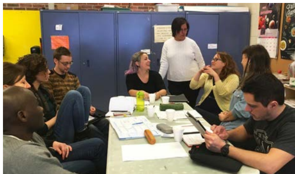
Le groupe de discussion des intervenants au secondaire