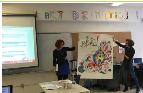
Un des systèmes d'émulation présentés pendant la formation

Merci à l'équipe de St-Nom-de-Jésus pour l'accueil dans leurs locaux !