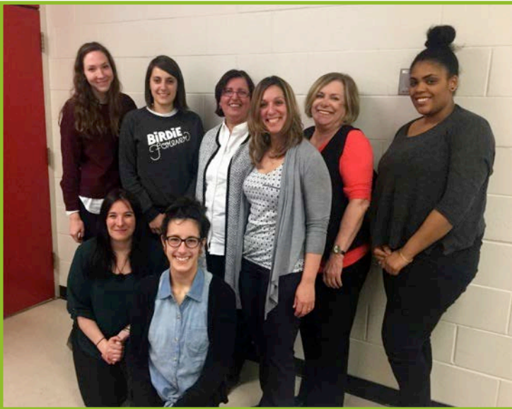
Équipe Des Livres en Visite