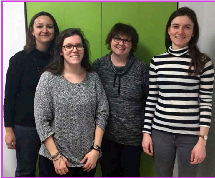
← École Notre-Dame-de-l'Assomption